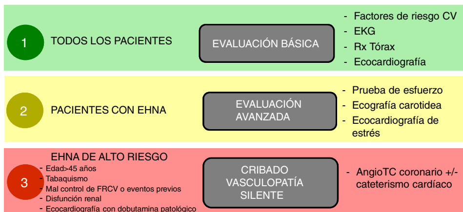
Figura 2 Esquema propuesto de evaluación cardiológica pretrasplante en función del riesgo cardiovascular.

Notas: Los factores de riesgo cardiovascular deben controlarse adecuadamente antes del trasplante.