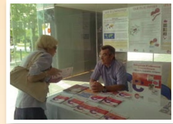
Taula Informativa a l'Hospital de Sabadell

Dia 28 de juny. Jornada d'Informació sobre les Hepatitis A, B i C. Detecció de l'Hepatitis C a la Plaça Lesseps en col·laboració amb Creu Roja Barcelona. Es va lliurar material informatiu i es van fer test orals de detecció ràpida del VHC de manera totalment anònima i gratuïta.