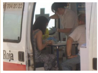
Jornada d'informació en col·laboració amb Creu Roja