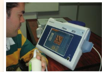
Jornada de proves amb Fibroscan