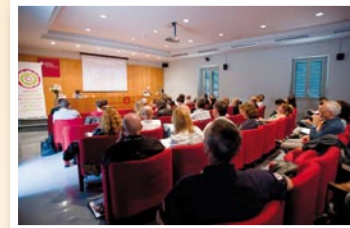
Una de les intervencions a les Jornades celebrades al Pati Manning de Barcelona