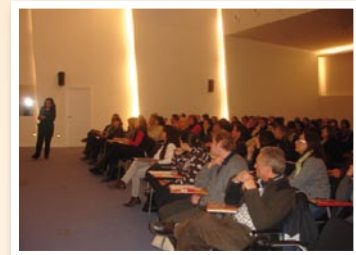
Conferència a Fedefarma

Mitjançant la col·laboració de col·lectius i entitats que estan en contacte amb la ciutadania: consultes d'odontologia, d'hepatologia, entitats de salut de l'àmbit universitari, associacions d'immigrants, etc.