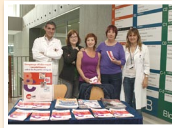
Taula a l'Hospital de la Santa Creu i Sant Pau